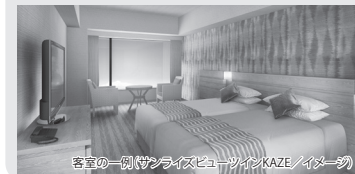
客室の一例(サンライズビューツインKAZE/イメージ)