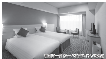
客室の一例(スーパーツイン/NAG)